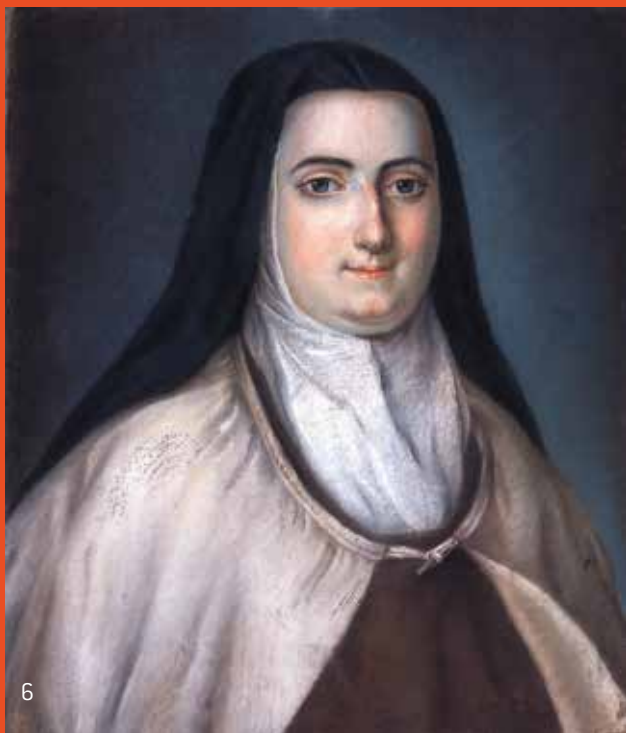
Anonyme, Madame Louise en carmélite en 1774