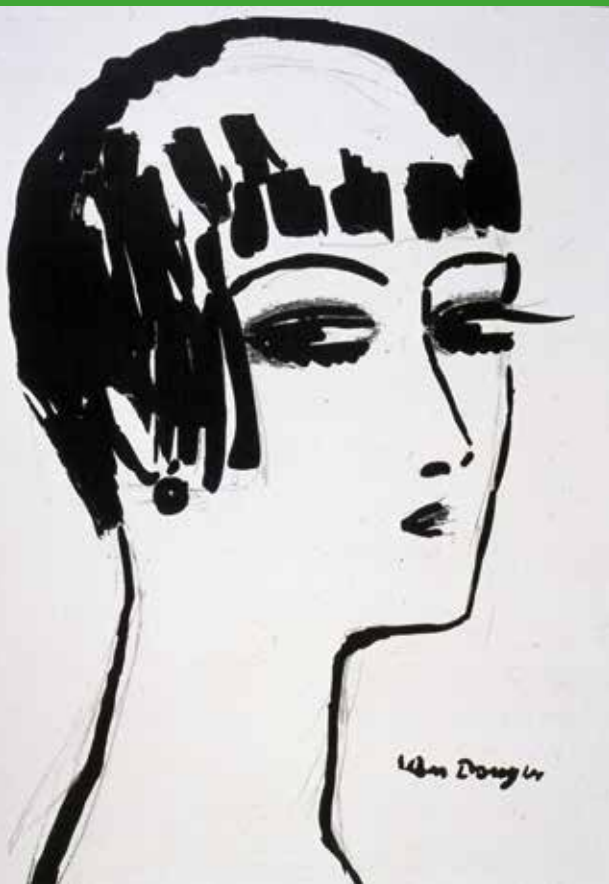
Kees Van Dongen, Les cheveux courts (1926) ADAGP, Paris 2017