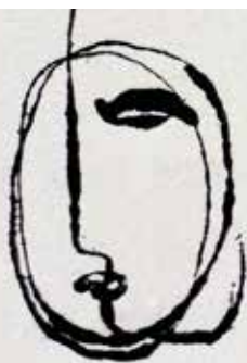
Jean Fautrier, Illustration pour Dignes de vivre de Paul Eluard (1943) ADAGP, Paris 2017

Un ensemble de dessins de Jean Fautrier (1898-1964) a été vendu aux enchères en mai 2017. Parmi eux, des dessins originaux réalisés en 1943 pour illustrer le recueil Dignes de vivre de Paul Eluard édité l'année suivante. La délégation permanente de la commission scientifique, chargée de rendre un avis sur ses projets d'acquisitions, a alors été sollicitée. Un représentant du musée s'est rendu en salle de vente, où marchands et collectionneurs se pressaient pour acheter des œuvres. Il a fallu se montrer stratégique : ne pas afficher l'intérêt de l'institution pour ne pas voir s'envoler les prix, se concentrer sur les œuvres les plus importantes au regard de la collection - tel le dessin illustrant le poème Liberté auquel le musée a consacré récemment une exposition - et tacher de constituer un ensemble cohérent. Quatre dessins ont ainsi pu être acquis par la ville de Saint-Denis, ils seront présentés dans les salles d'exposition permanente du fonds Paul Eluard en 2018.