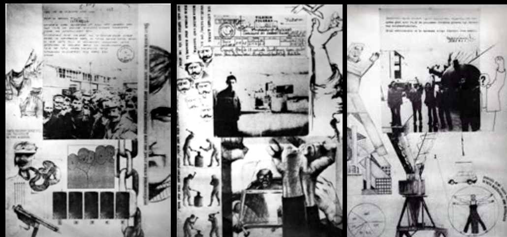
1, 2 et 3