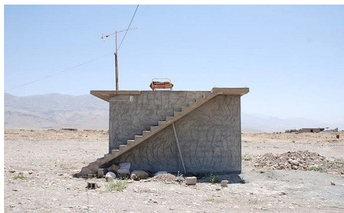
Hiwa K (né en 1975 en Irak) One room apartment

Contacts presse : Agnès Renault Communication 01 87 44 25 25