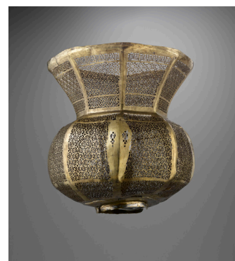
Lampe de mosquée - XIème siècle - Musée du Louvre