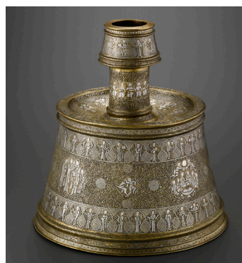
Chandelier - XIIIème siècle - Musée du Louvre

Pour chaque accrochage, 10 œuvres, à la fois historiques et contemporaines, issues du département des Arts de l'Islam du musée du Louvre et de collec-