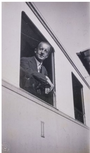
Anonyme, Portrait de Paul Eluard