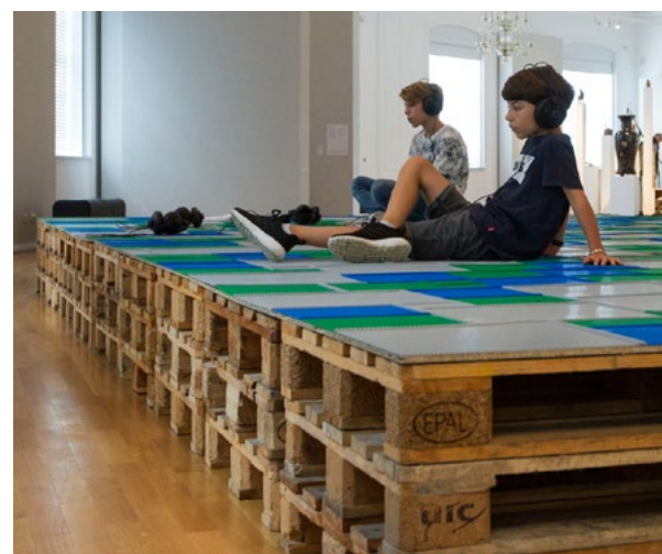
Natascha Sadr Haghghian, pssst Leopard 2A7+, 2013, vue de l'installation à la Kunstsammlung Gera, 2021, photographie : ARTwork-Stewe, © Natascha Sadr Haghghian

Duet repose sur une composition pour deux personnes. Ce « duo » écrit par Ari Benjamin Meyers est constitué de deux parties et nécessite deux voix spécifiques : celle d'une personne initiée par l'artiste et celle d'un visiteur, sollicité au hasard pour chanter en recevant un protocole qui n'exige aucune connaissance musicale. Il en émerge des moments d'échanges vocaux impliquant autant le chanteur que le public. Avec les élèves du conservatoire de Saint-Denis.