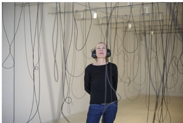
Christina Kubisch, La Serra , 2017/22, vue de l'installation à la Stadtgalerie Saarbrücken, 2019, photographe : Katrin Krämer, Courtesy Christina Kubisch @adagp, Paris 2022

Tarif : 5€ - Réservation sur exploreparis.com