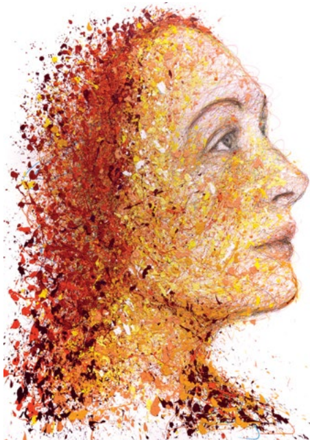
Hom Nguyen, Nusch Eluard , juin 2023, technique mixte sur toile

L'exposition a reçu le soutien du fonds de dotation Ambition Saint-Denis.