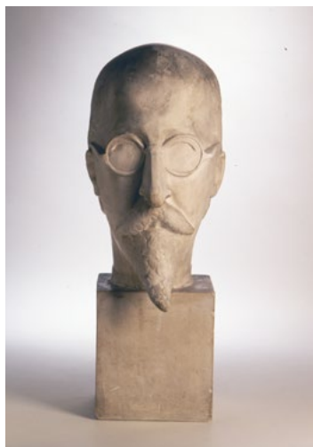
Chana Orloff, Francis Jourdain , 1927, plâtre.

23 février au 7 juillet 2024 Bard Graduate Center, New York