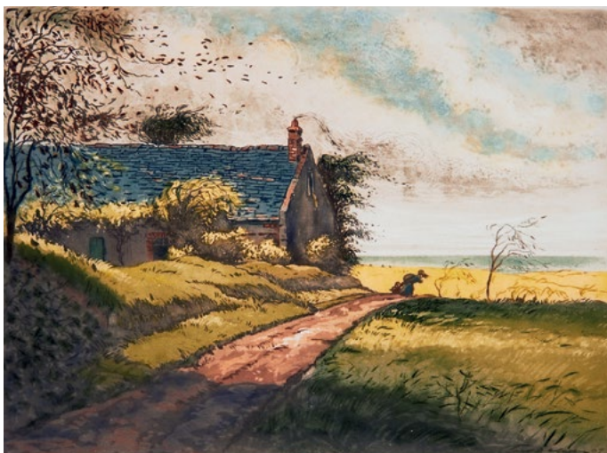
Eugène Delâtre, Chaumière dans le vent à Cayeux , 1870, eau-forte et aquarelle couleurs sur papier.

Tarif : droits d'entrée du musée inclus aux animations