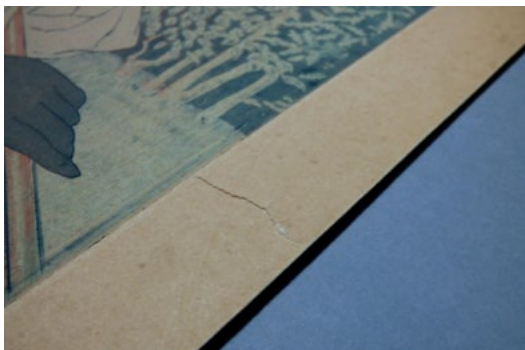
Déchirure sur l'œuvre

En prévision de l'exposition consacrée aux imprimeurs-graveurs Auguste Delâtre et son fils Eugène, certaines œuvres reçoivent des soins particuliers pour améliorer leur état de conservation et de présentation. Près d'une vingtaine d'estampes ont ainsi bénéficié d'un traitement par une restauratrice en arts graphiques. Les œuvres ont été dépoussiérées recto-verso, les anciens adhésifs retirés et les plis et déchirures consolidés. Deux œuvres, fortement oxydées, ont fait l'objet d'un traitement plus approfondi. À l'issue de ce chantier, les œuvres sont montées sous passe-partout et encadrées pour être présentées dans l'exposition Un siècle d'impression(s). Dans l'atelier des Delâtre à Montmartre .